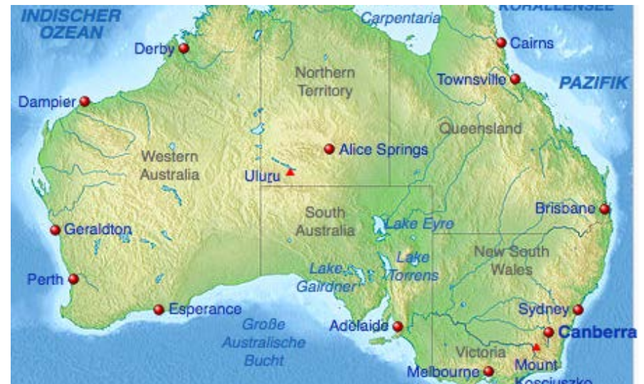
Wikipedia und Виктор В