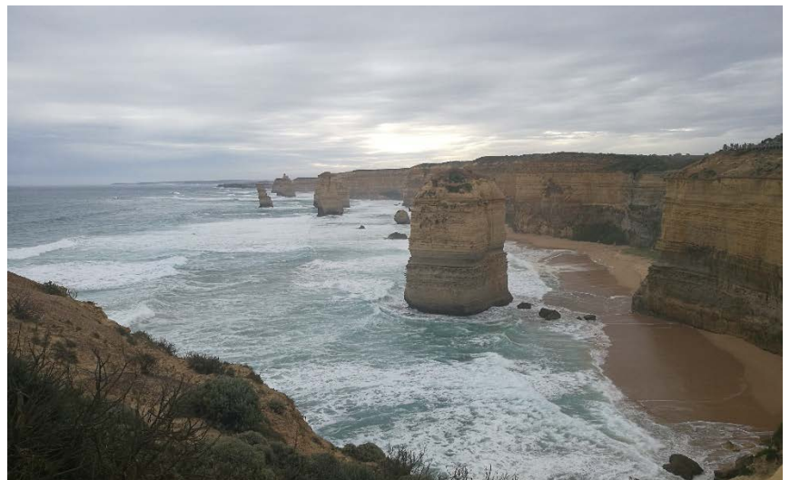
Lucky You Found Me | Sydney, Australien